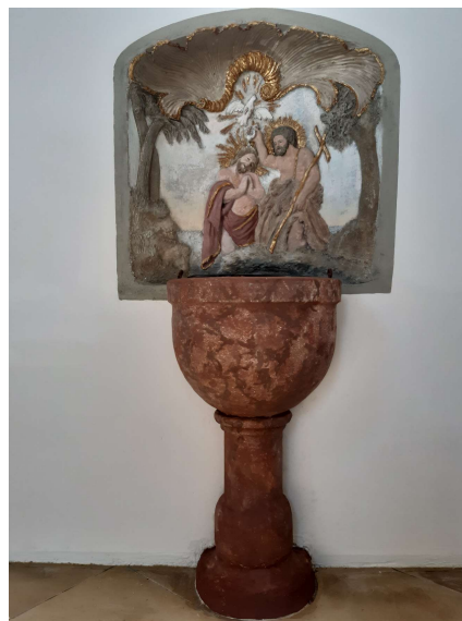
Johannes tauft Jesus

Diese Teile weisen mehrere farbliche Ausbesserungen auf.